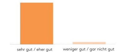
Wie zufrieden sind Sie ganz allgemein mit dem Kultur-, Freizeit-, Sport- und Vereinsangebot in Pfullingen?