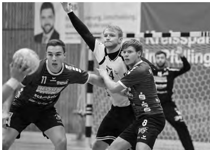
In Saarlouis will der VfL den Sieg aus der Hinrunde wiederholen.