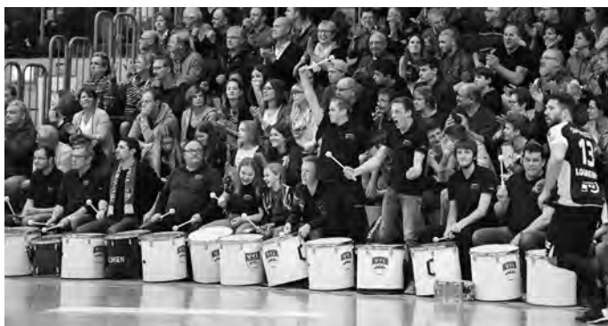
Die Trommler der Handballer - zuhause und auswärts stark!

Am Samstag, 16.02.2019 , gastieren die Pfullinger Drittligaherren bei der HG Saarlouis - das erklärte Ziel ist hierbei die ersten Auswärtspunkte des Jahres einzufahren und sich teuer zu verkaufen. Das Team würde sich freuen, wenn wieder viele Fans und Trommler mitfahren würden.