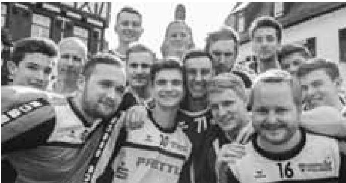
Die Landesligaherren freuen sich auf das Derby beim Aufsteiger TV Großengstingen und den Pokalfight in Mössingen.