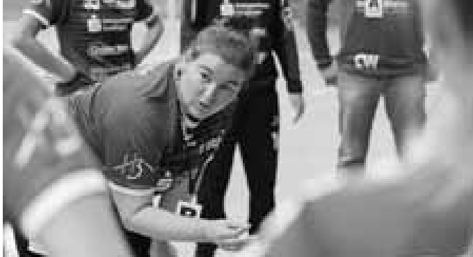
Am Sonntagnachmittag spielen die Württembergligadamen.