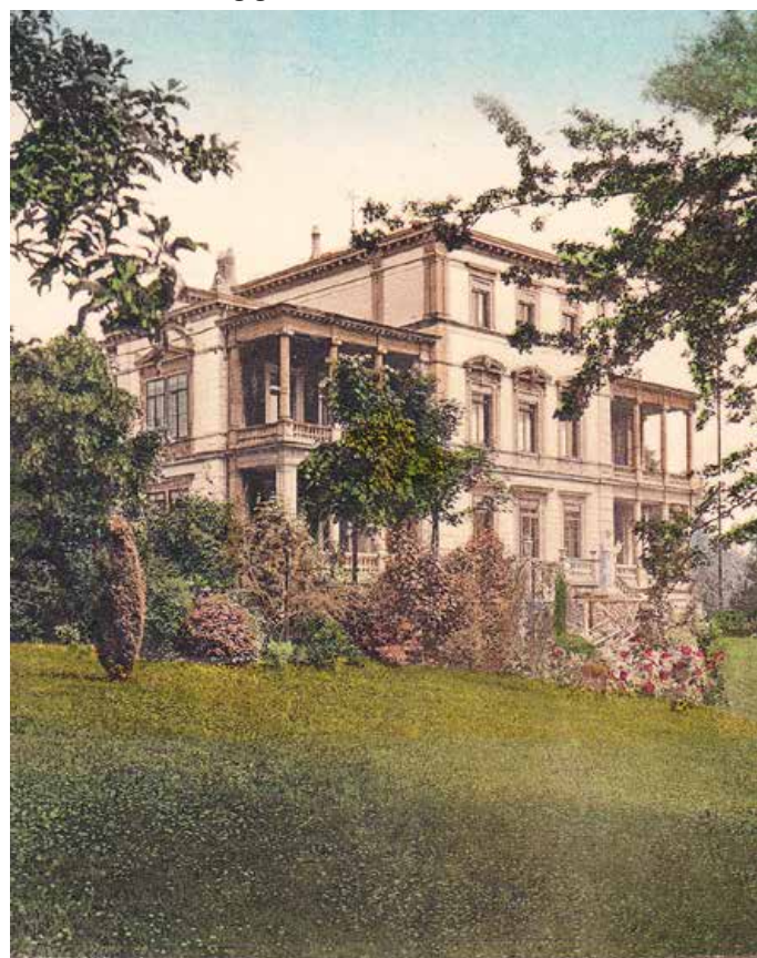
Gruss aus Pfullingen

Die Ausstellung in der Villa Laiblin ist an den folgenden Sonntagen geöffnet: 3.6.; 1.7.; 5.8.; 2.9.; 9.9.2018 (Tag des offenen Denkmals); 7.10. Außerhalb der Öffnungszeiten können Führungen über die Stadtverwaltung gebucht werden.