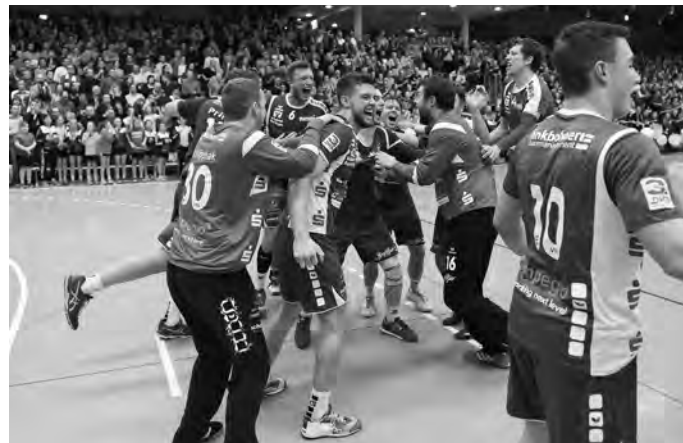
Am Samstagabend soll im VfL-Lager wieder so gejubelt werden können.

17:00 Uhr Herren, Landesliga TSV Köngen - VfL Pfullingen 2