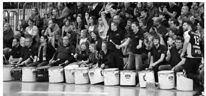
Die Trommler der Handballer - zuhause und auswärts stark!