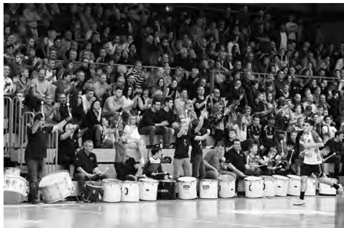
Die Trommler der Handballer - zuhause und auswärts stark!

Am Freitag, 01.12.2017 , gastieren die Pfullinger Drittligaherren beim Lokalrivalen TV Neuhausen.