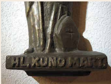
Mitra d. hl. Erzbischofs v. Trier zu Füßen (St. Wolfgang Pfullingen)