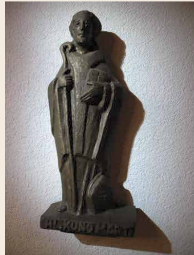
Statue in der Kirche St. Wolfgang Pfullingen (Künstlerin: +Gisela Bär, Pforzheim, 1985)