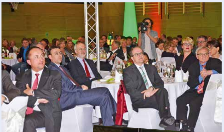
Gespannte Aufmerksamkeit bei den Gästen