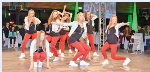
Bei fetziger Musik in Bestform: Die Pfullinger Hip-Hop- und Videoclip-Tanzgruppe „Independent Steps“!