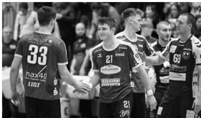
M1 hat am Samstag Balingen zum Derby zu Gast