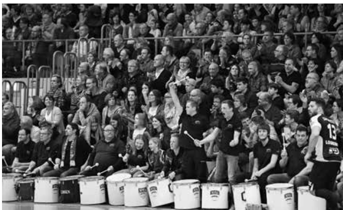
Die Trommler der Handballer - zuhause und auswärts stark!

Am Samstag, 15.09.2018 , gastieren die Pfullinger Drittligaherren beim Zweitligaabsteiger HSG Konstanz - das erklärte Ziel ist hierbei Zählbares mitzunehmen und sich gegen Tölke, Keupp & Co. teuer zu verkaufen.