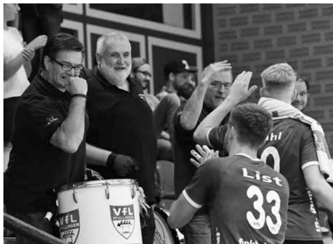
Am Samstagabend gastieren die Drittligaherren bei der HSG Konstanz - und setzen auch dort wieder auf die Unterstützung ihrer Fans.